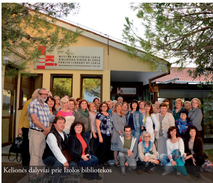
Kelionės dalyviai prie Izolos bibliotekos

Vida Marcinkienė, Radviškių viešosios bibliotekos direktorius pavaduotoja