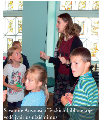
Savanorė Ansatasija Terskich bibliotekoje vedė įvairius užsiėmimus