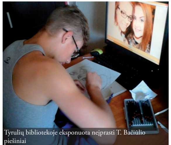
Tyrulių bibliotekoje eksponuota neįprasti T. Bačiūlio piešiniai