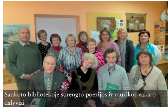
Šaukoto bibliotekoje surengto poezijos ir muzikos vakaro dalyviai

*Šios bibliotekos tradicija – kiekvieną lapkritį rengiama Šeimos savaitė, sukviečianti vaikus kartu su tėveliais, seneliais. Šiomet viena savaitės diena buvo skirta spalvinimui, kita – kryžiažodžiams, o pagrindiniame renginyje kalbėta apie draugystę, susipažinta su geriausiomis šiemetėmis knygomis vaikams, pamatytas Viešosios bibliotekos lėlių teatro „Boružėlė“ spektaklis.