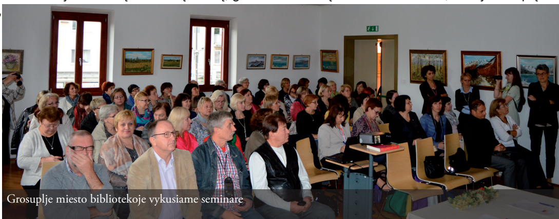
Grosuplje miesto bibliotekoje vykusiame seminare