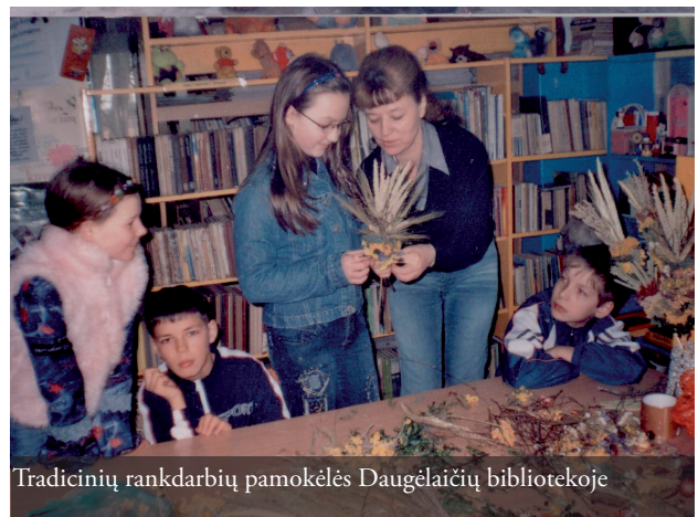
Tradicinių rankdarbių pamokėlės Daugėlaičių bibliotekoje